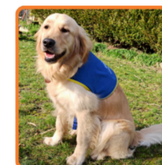
Détente et apprentissage social - éducatif avec RAYA