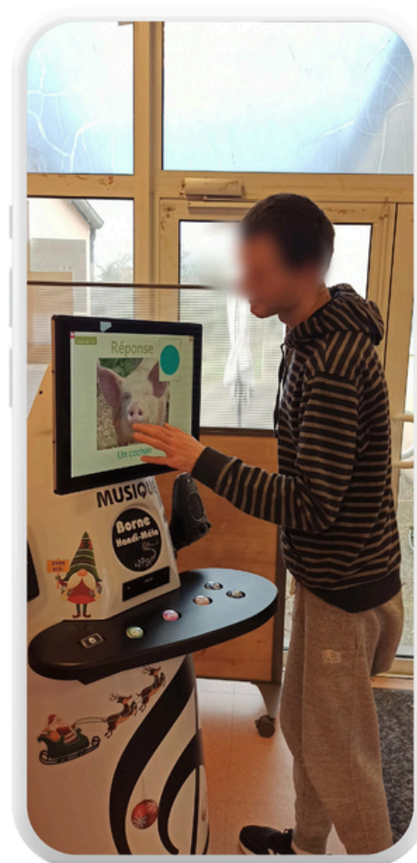
Imprimé par nos soins